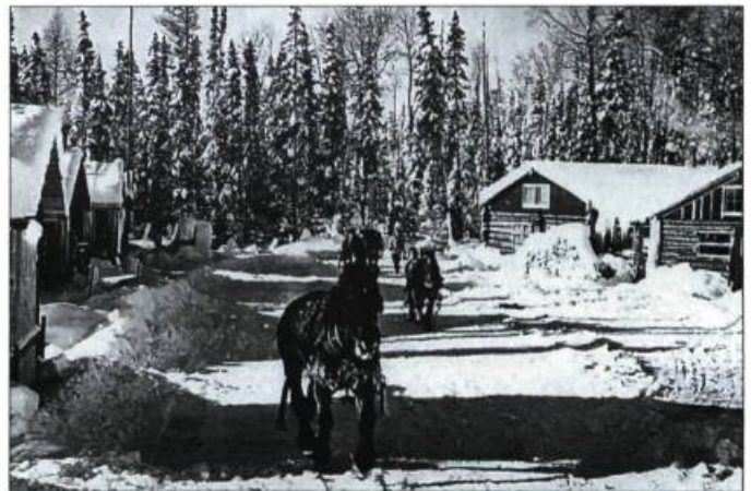
Un chantier de la Haute-Gatineau au début du siècle.

Chassées de leur pays en 1650 par les raids dévastateurs des troupes iroquoises et par les maladies contagieuses mortelles, les nations algonquines, maîtresses séculaires des affluents de l'Outaouais et de la Gatineau, se réfugient auprès des Français à Trois-Rivières et à Montréal. Regroupés en 1721 à Oka, non loin du nouvel établissement des Mohawks, leurs ennemis héréditaires, les Algonquins fréquentent toujours la Haute-Gatineau pendant la saison de la chasse, remontant les rivières dès les premiers signes de l'automne. Les familles « canadiennes », c'est-à-dire québécoises, établies le long de la rivière des Outaouais et de la Gatineau s'habituent aux convois de canots d'écorce et prennent l'habitude d'appeler cette saison l'« été des Indiens ».