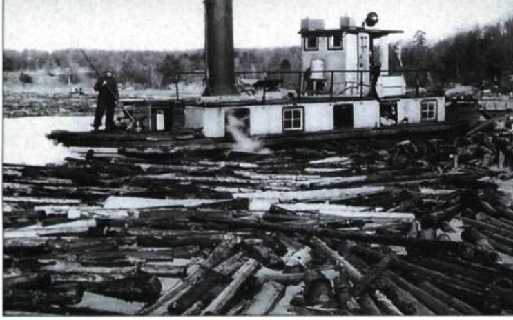
Le réservoir du Baskatong vers 1930.

coule à flot. On fête la pakwaun , c'est-à-dire le dégel, qui est synonyme d'abondance et de retrouvailles. (Cette fête se perpétue encore de nos jours, à l'époque du réveil du « siffleux », à Maniwaki.)