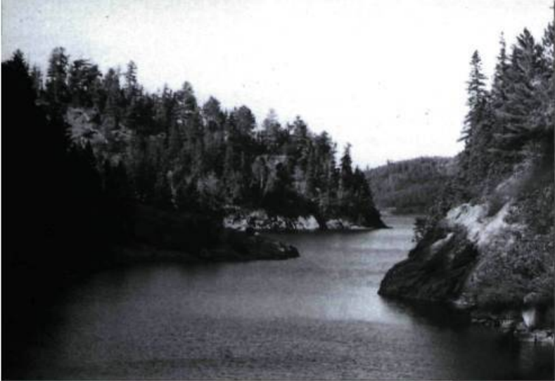
Entre les lacs David et Pythonga.