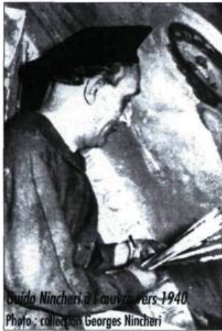
Guido Nincheri à l'œuvre vers 1940.