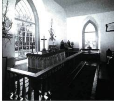
Il se dégage de l'église Saint-Paul de Cumberland une sobriété tranquille et une ambiance propice à la rêverie.