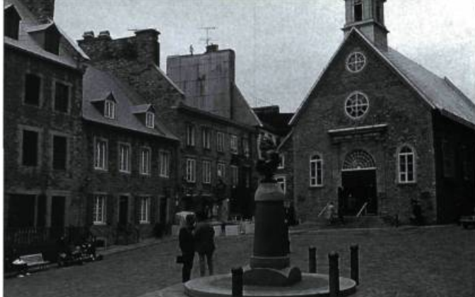
Place Royale, Québec

Les autorités municipales de Cantorbéry, en Angleterre, en savent aussi quelque chose. La cathédrale de Cantorbéry et son enceinte, l'abbaye Saint-Augustin et l'église Saint-Martin, est l'un des sites du patrimoine mondial. Historiquement, Cantorbéry est le berceau de la chrétienté britannique et a été associé à l'expansion du christianisme à compter du VI e siècle. Siège primatial pour l'ensemble de l'Angleterre depuis le XI e siècle, Cantorbéry fut, au Moyen Âge, après le martyre de saint Thomas Becket, l'un des trois lieux de pèlerinage les plus fréquentés en Europe. Cette petite ville de 41 000