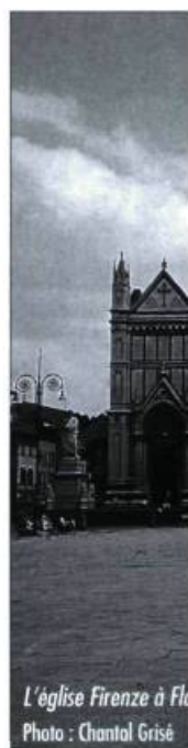
L'église Firenze à Florence