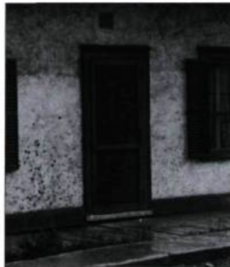
Les divisions de la porte moustiquaire de bois devraient coïncider avec celles de la porte principale.

être peinte de la même couleur. Pour son installation, les mêmes peintures que celles de la double porte peuvent être utilisées : il suffit de retirer les tiges amovibles de cette dernière, de dévisser les moitiés de charnières du montant de la double porte et de les fixer à la porte moustiquaire en les ajustant de telle façon qu'on n'aura pas à déplacer les pentures de l'encadrement de la baie de la porte. Il est possible de faire des découvertes en fréquentant les revendeurs de matériaux de démolition : ces derniers offrent un assortiment quelquefois impressionnant de portes de toutes sortes, dont des portes moustiquaires.