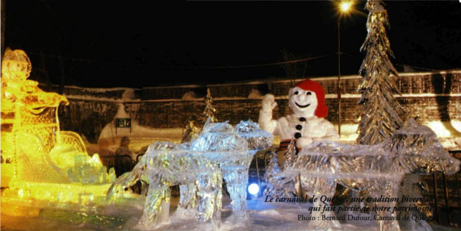
Le carnaval de Québec, une tradition hivernale qui fait partie de notre patrimoine.

I l était une fois un pays, un pays de neige et de froid qui souhaitait oublier et la neige et le froid plutôt d'en faire un élément de joie; ainsi naquit au cœur blanc de l'hiver, le carnaval de la Vieille Capitale!