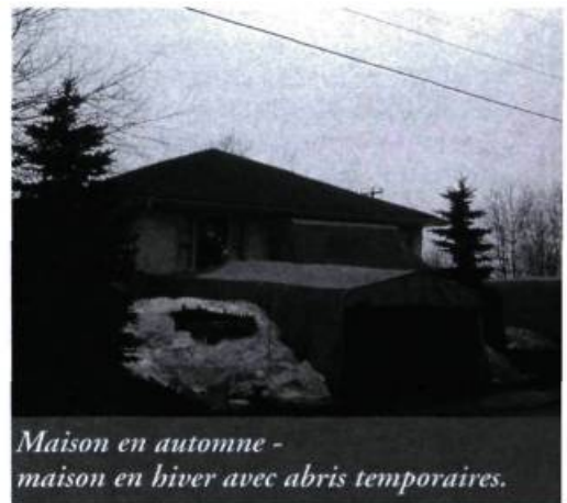
Maison en automne - maison en hiver avec abris temporaires.

Aujourd'hui, ce sont les développeurs qui tracent les rues et qui fixent l'orientation sans tenir compte du sud ou des vents dominants. L'orientation des rues est surtout fixée pour faciliter l'installation de l'infrastructure des égouts, aqueducs, etc. et non pour la meilleure adaptation aux conditions climatiques. En observant la physionomie