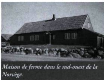
Maison de ferme dans le sud-ouest de la Norvège.

Selon l'architecture vernaculaire norvégienne, dans le sud-ouest du pays, une pièce plus basse que la partie principale de la maison était ajoutée aux extrémités des maisons et des granges et l'on orientait l'ensemble en fonction des deux vents dominants de la région. Ces deux appendices obligent le vent à passer au-dessus du corps principal de la