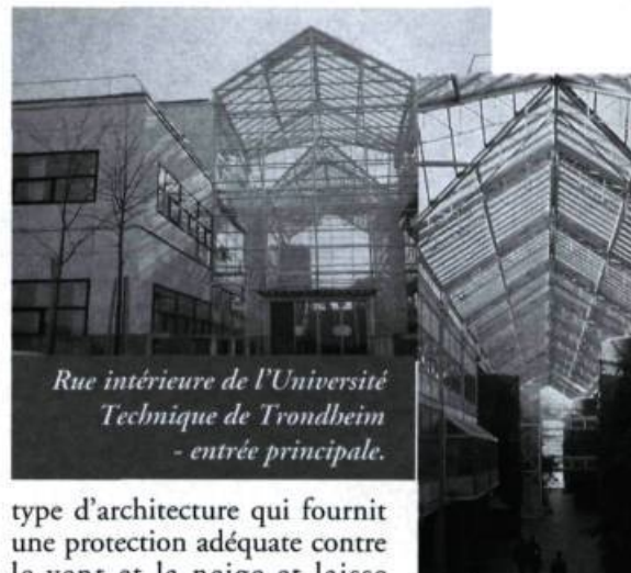
Rue intérieure de l'Université Technique de Trondheim - entrée principale.

L'édifice de l'Université Technique de Trondheim, à Dragvoll, illustre un