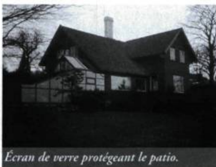
Écran de verre protégeant le patio.

À Stavanger, dans le sud-ouest du pays, une maison conçue récemment par l'architecte Einar Myklebust reprend ce concept en intégrant les deux appendices dans la forme de base de la maison. L'ajout d'un sas dans l'entrée principale sert de transition entre le froid de l'extérieur et la chaleur de l'intérieur, ce qui empêche le vent de pénétrer directement dans la maison; de plus, une fenestration adéquate permet de capter la radiation solaire, générant ainsi plus de chaleur dans la zone de transition.