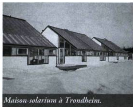
Maison-solarium à Trondheim.

type d'architecture qui fournit une protection adéquate contre le vent et la neige et laisse pénétrer les rayons du soleil. Ce projet, qui a remporté le premier prix lors d'un concours international, a été réalisé par l'architecte Henning Larsen. L'ensemble se présente sous la forme d'une ville avec des rues entre des groupements de salles de cours, de bureaux, d'auditoriums, la librairie, la cafétéria, les boutiques, etc. Ce concept est unique, en ce sens que les rues sont couvertes et que les galeries vitrées assurent une constante protection contre la neige et le vent et qu'elles laissent pénétrer le soleil. Ces rues s'alimentent de la chaleur échappée des groupements de pièces environnantes; ainsi, dans la rue, l'air est plus chaud qu'à l'extérieur, mais moins chaud que celui des pièces habitées. Il s'agit d'une véritable zone de transition entre la température basse de l'extérieur et la température de confort de l'intérieur. Les gens peuvent donc circuler librement, vêtus pour affronter une température printanière ou automnale.