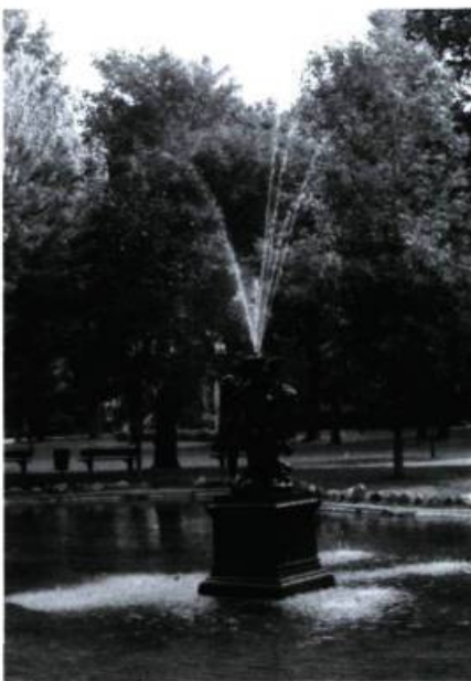
Fontaine du bassin McDougall (1916), dans le parc Outremont, inspirée par les Groupes d'enfants qui ornent le parterre d'eau du château de Versailles.

Ceux qui s'avanceront avenue Champagneur (5) pourront découvrir une jolie paire d'habitations exceptionnellement réunies par une arche chevauchant l'allée des voitures (n° 420 et 426; maisons de M me A. Roy; J.-A.-S. Houle, arch.; 1936), une série de dix maisons jumelées présentant d'étonnantes colonnes ioniques en béton (n° 430 à 494, construites pour L.-A. Beauchemin; concepteur inconnu; 1919-1920), de très sympathiques cottages jumelés traités à la manière de bungalows dont il faut observer