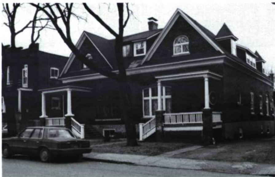
Maison P. Guidazio, 327, Querbes (1912).

Vers le nord (7), il faut absolument voir sur l'avenue Bloomfield les 12 cottages qui s'étendent entre les numéros 474 et 520 et rivalisent de luxe ou d'originalité pour ce qui est du décor. Construits en série la même année pour le même client et par le même architecte, ils reprennent essentiellement le même parti, mais le traitement de la façade est sans cesse renouvelé au point qu'ils apparaissent parfaitement individualisés. Seule leur commune exubérance ornementale peut mettre la puce à l'oreille (maisons B. Damien; J.-A. Godin, arch.; 1912).