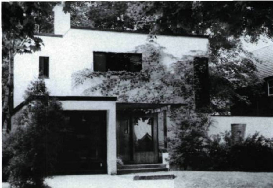
Maison A.-L. Gravel, 268, McDougall (W. Ralston, arch.; 1936).

motif de feuilles d'acanthé (résidence P. Guidazio; concepteur inconnu; 1912) et la dernière pour son entrée et son balcon enfoncés, sa forte corniche à modillons et le grand arc qui couronne la travée du salon (maison Georges Vaillancourt; concepteur inconnu; 1911).