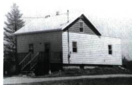
3.-4. Deux manières bien différentes de traiter l'intégration d'une annexe. Dans un cas, le nouveau volume est légèrement en retrait et délimité par des planches cornières; l'utilisation du bardeau comme revêtement assure à cet ajout une intégration harmonieuse. Dans l'autre cas, on a opté pour un matériau tout à fait différent et créé un déséquilibre volumétrique.