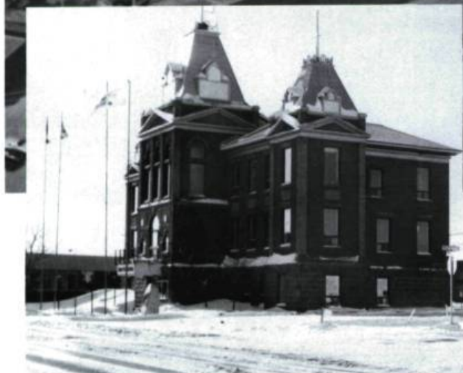
L'hôtel de ville de Roberval est un des rares édifices publics qui témoigne de la survie du «style municipal» développé à Québec par l'architecte Georges-Émile Tanguay peu avant 1900.