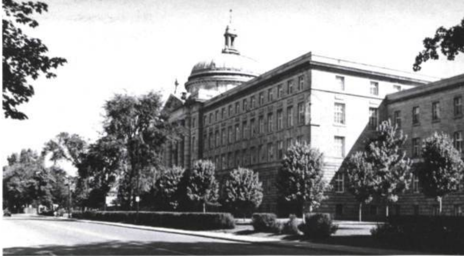
Une construction monumentale, le Séminaire de Trois-Rivières. Louis-Napoléon Audet; Asselin et Denoncourt, architectes, 1927.

Hommes d'affaires et industriels multiplient les usines dans des villes nouvelles de la Mauricie, du Saguenay-Lac-Saint-Jean et de l'Abitibi-Témiscamingue ainsi que dans les villes anciennes, particulièrement à Montréal. Pendant ce temps, les immeubles commerciaux rivalisent en grandeur et en magnificence. L'édifice Price à Québec et la Banque Royale à Montréal, élevés à la fin des années vingt, sont au nombre de ces édifices qui, pour la première fois, dépassent les églises dans la silhouette de ces villes. Depuis les travaux effectués à la Banque de Montréal au début du siècle, les banques aussi attirent l'attention, principalement par l'ampleur de leur hall et la richesse des matériaux qui l'ornent. Le style classique retenu pour la plupart de ces constructions vise à conférer une image de dignité et de stabilité aux entreprises qu'elles abritent.