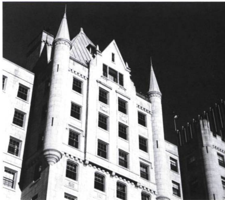
Les appartements Le Château, rue Sherbrooke à Montréal. Ross & MacDonald et Fetherstonhaugh, architectes, 1925.

A u cours du XX e siècle, l'architecture québécoise a évolué plus que jamais auparavant. Elle a troqué l'apparence lourde qui la caractérisait au début du siècle pour la légèreté et la transparence. Les minces parois de verre ont remplacé les colonnades de pierre. D'immenses espaces internes éclairés par la lumière du jour sont mis à la disposition des promeneurs dans des types de bâtiments où, il y a à peine vingt ans, ils longeaient des corridors privés de lumière naturelle. De nouveaux types de constructions ont également vu le jour depuis un siècle, tels que les gratte-ciel, les motels, les stations-service, les aéro-gares et les centres commerciaux, tandis que des types anciens, comme les églises, ne sont guère reconnaissables. Ces changements sont surtout survenus après la Seconde Guerre mondiale, mais déjà au cours des cinquante années précédentes, l'architecture avait connu une évolution qui, sans être aussi spectaculaire, n'annonçait pas moins une ère de profonde mutation.