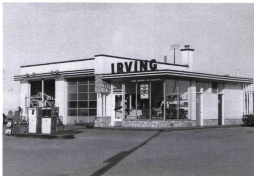
À Montréal, une des rares stations-service qui subsiste des années cinquante.

Le modernisme architectural, qui exploite les nouveaux matériaux ainsi que les techniques industrielles et qui se caractérise par des formes géométriques, privées de décor et définies par la fonction qu'elles renferment, s'est manifesté timidement entre 1935 et 1945. Après la guerre cependant, il ne tarde pas à s'imposer partout. Cette architecture, que ses auteurs veulent résolument différente de celles qui l'ont précédée, profite alors d'une conjoncture favorable. La reprise économique contribue à l'enrichissement général. L'automobile, objet d'idolâtrie, se trouve désormais à la portée d'un grand nombre. Elle facilite les déplacements et développe le goût de voyager. Elle aura d'ailleurs un effet décisif sur l'aspect des nouveaux quartiers à la périphérie des villes. Par surcroît, le coût relativement bas des terrains hors des villes exerce une forte attraction et concourt, à sa manière, à façonner l'image de la banlieue.