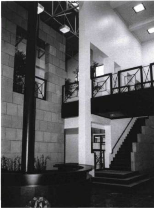
Les espaces intérieurs du siège de la société Johnson et Johnson à Montréal. Cayouette et Saia, architectes, 1986.

La Maison Alcan et le siège de la société Johnson et Johnson prouvent que l'insertion peut surtout engendrer la formation d'espaces externes bien définis et pittoresques, si l'on exploite les textures et les articulations des bâtiments anciens. Mais ces deux oeuvres se distinguent de plus par de grands espaces internes inondés de lumière naturelle, un attribut que possèdent bon nombre d'édifices publics et commerciaux construits au cours des vingt dernières années. Souvent ces espaces s'ouvrent directement sur l'extérieur pour communiquer avec la rue, contrairement aux galeries souterraines ou autres de la Place Ville-Marie et de la Place Bonaventure. Les nouveaux espaces ne se contentent pas de fournir un abri; ils visent en outre à procurer un plaisir à leurs usagers.