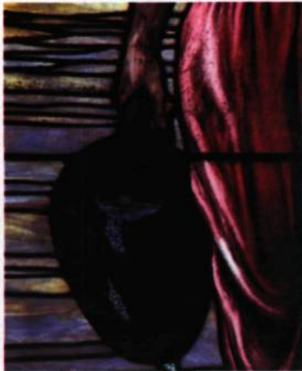
Verres plaqués rouge travaillés à l'acide pour obtenir des dégradés, dans le cas du vêtement, et pour permettre l'utilisation de la peinture bleue (émaux) qui figure l'eau de la cruche.