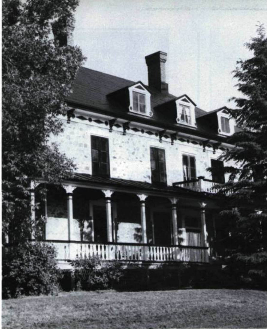
Le manoir de Saint-Ours: le calme et la sérénité du seul domaine seigneurial québécois encore occupé par les descendants en ligne directe du premier seigneur.