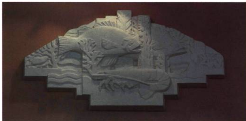
Un des bas-reliefs réalisés par le sculpteur français Denis Gélín.

La salle à manger, une vaste nef scandée par des piliers de marbre importé de France, est inspirée de celle qu'a créée Pierre Patou sur le paquebot Île-de-France (1927). Extrêmement raffinée, l'harmonie en rose, gris et beige est caractéristique du style Art déco. Éclairée de verrières translucides soulignées de noir et arrondies aux angles pour donner un caractère plus «aérodynamique» à l'ensemble, cette «cathédrale de la gastronomie» est délimitée en son pourtour par une estrade. En ses extrémités, des fontaines encastrées sont surmontées par