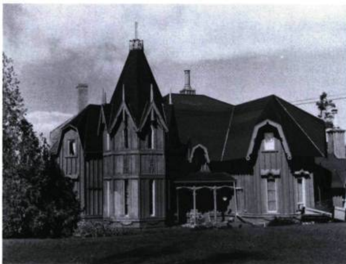
Pine Cottage à Cacouna (1867) mieux connu sous le nom du «Château vert».

Kamouraska, Notre-Dame-du-Portage, Saint-Patrice, Rivière-du-Loup, Cacouna, voilà autant de noms qui évoquent l'âge d'or de la villégiature au Québec. Kamouraska aurait été, à l'instigation du seigneur Taché, le premier grand lieu de villégiature au Québec. Les grands hôtels qui ont fait la réputation du Bas-du-Fleuve au tournant du siècle, comme le St. Lawrence Hall de Cacouna, n'existent plus. Subsistent quelques pensions et des petits hôtels ainsi que des villas et chalets d'été le long du Saint-Laurent. On trouve de belles concentrations de villas à Saint-Patrice, dont celle de John A. MacDonald, ainsi