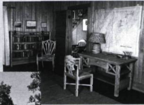
Intérieur typique de Warren, fait de pin laissé au naturel. Le mobilier, d'inspiration américaine, a été dessiné par l'architecte et fabriqué par l'artisan Joseph Riverin de Cap-à-l'Aigle.