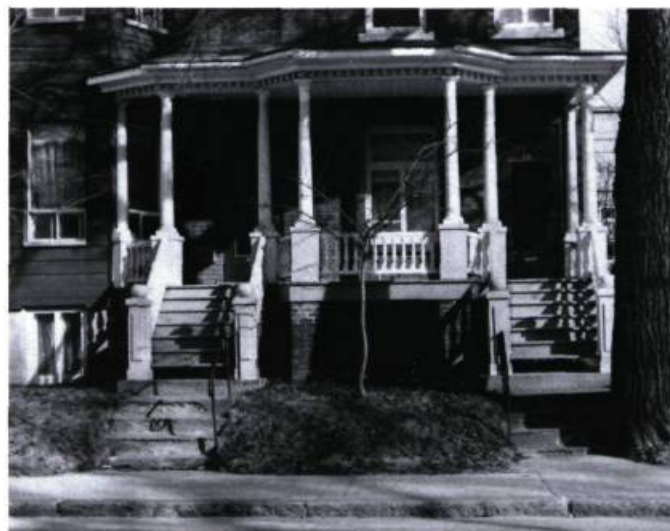
Quand la galerie sert à personnaliser un bâtiment.

Avant d'entreprendre des travaux de réparation ou de transformation d'une galerie ou d'un balcon, il convient de bien évaluer l'importance de ces éléments architecturaux. Les aspects suivants devraient être considérés: Quel rôle joue l'élément dans la définition du caractère et du style du bâtiment? Y a-t-il cohérence du langage architectural utilisé? Quelle contribution apporte-t-il dans l'équilibre des volumes de l'ensemble? Quelle est la qualité de l'espace défini par cet élément?