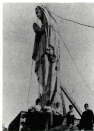
La statue de Notre-Dame du Saguenay, au sommet du cap Trinité.

L'Anse-Saint-Jean. Au cœur du village se trouvent trois constructions d'intérêt: un pont couvert (1930), le presbytère et l'église de pierre (David Ouellet arch., 1890) qui renferme une statue polychrome de Louis Jobin représentant saint Jean-Baptiste (1883).