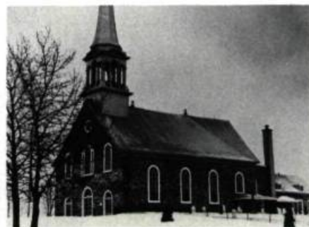
L'église Notre-Dame de Laterrière.

La Baie. Sur l'actuel territoire de la ville se trouvent deux des plus anciennes églises de la région: l'église Saint-Alexis de Grande-Baie (1867) et l'église Saint-Alphonse de Bagotville (1862). L'église Saint-Marc, (Paul-Marie Côté arch., 1955-1956): une des églises modernes les plus spectaculaires du Québec, premier exemple de la remarquable série «d'églises blanches» de la région. Le Musée du Fjord, 3346, boul. de la Grande-Baie Sud, centre d'exposition d'art et d'ethnographie.