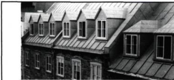
Îlot Saint-Nicolas Québec

Du 17 septembre au 2 novembre 1987, le Musée de la civilisation reçoit à la Maison Chevalier la prestigieuse collection du Museum of American Folk Art de New York. L'exposition qui circule avec grand succès en Amérique et en Europe permet un regard sur l'art populaire en tant qu'art réel et comme expression d'un pays neuf. American Folk Art: Expressions of a New Spirit , c'est au total 142 oeuvres, parmi les plus beaux objets du genre, qui viennent témoigner de cet héritage culturel fort riche et combien recherché par les collectionneurs. La Maison Chevalier est située au 60 rue du Marché Champlain, Place Royale, à Québec. L'entrée est libre. P.T.