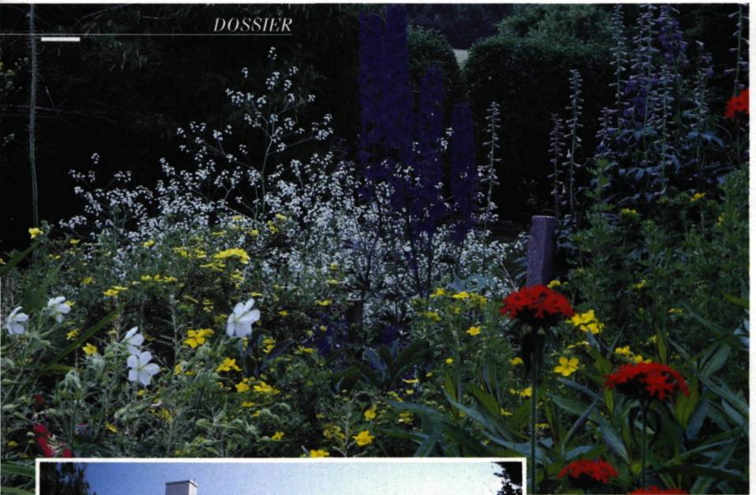
Les hampes d'un bleu violacé des delphiniums surplombent d'exubérantes vivaces aux coloris éclatants.