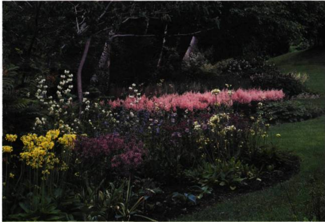
Épousant les méandres d'une pelouse moelleuse, une bordure de vivaces se pare de teintes d'aquarelle.

Ces deux axes étaient déjà établis au début des années trente et donnent toujours satisfaction. Ils forment l'ossature du jardin et sont l'oeuvre de deux oncles architectes et artistes, aujourd'hui disparus.