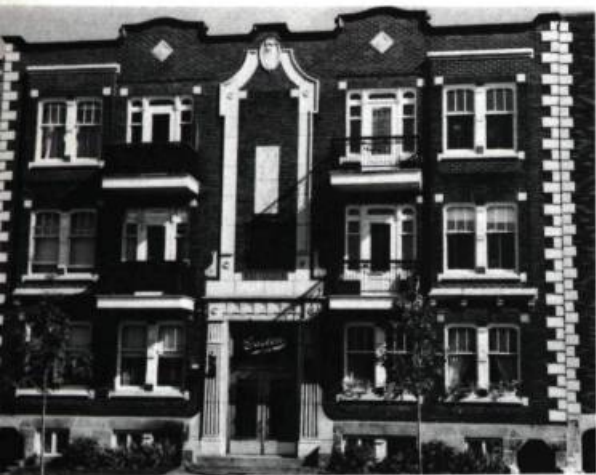
◀ Au Gaston, le grand trumeau central, les chaînes d'angle et les mascarons sculptés témoignent d'une nouvelle recherche dans l'ornementation.