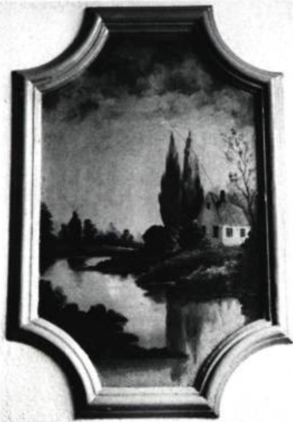
Des toiles marouflées illustrant des scènes bucoliques ornent les murs du hall du Gaston.