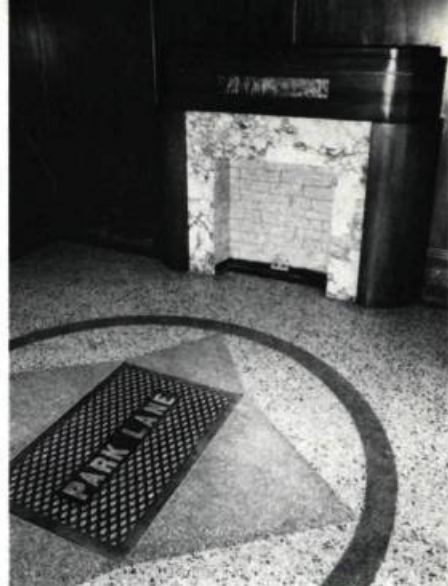
Dans le hall du Park Lane, trône une imposante cheminée.