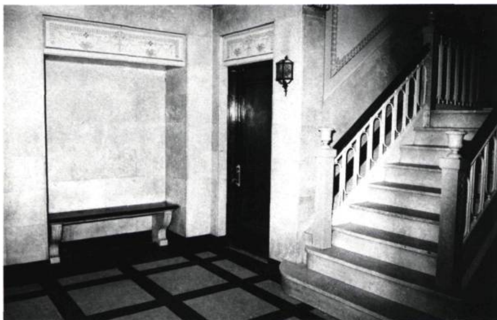
Le vestibule du Richelieu, avec ses parements de marbre et un banc encastré, arbore un certain luxe patricien.

Jusqu'au milieu du siècle, les immeubles résidentiels se paraient de fronton, guirlandes, mascarons. . .