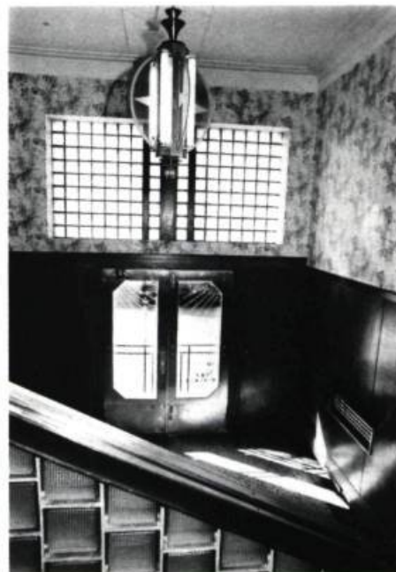
Un très beau luminaire, qui reprend le motif central du revêtement de terrazzo , orne le hall d'entrée du Park Lane.

Le Park Lane est l'un des rares immeubles résidentiels qui ait été conçu dans l'esprit de l'Art déco, soit le courant moderne des années d'avant-guerre. En cela, il diffère des immeubles cités précédemment qui reproduisent des décors architecturaux déjà, à cette époque, révolus.