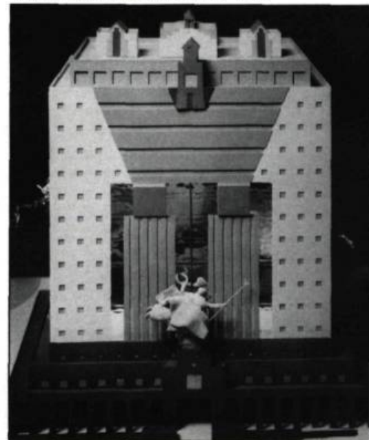
Maquette du Portland Building de l'architecte Michael Graves. Premier gratte-ciel post-moderne, cet immeuble de services municipaux de Portland en Oregon, est conçu en fonction de la tripartition classique: socle, volume, amortissement.