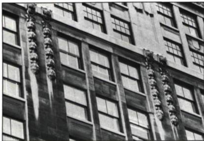
Le Insurance Building (272, rue Saint-Jacques). À cause de leur sobriété, les décors s'isolent de la structure et nous permettent de les apprécier dans le détail.