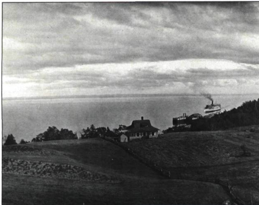
Vue panoramique sur le fleuve Saint-Laurent vers 1920. Au loin, un vapeur de la Canada Steamships Lines se dirige vers le quai de Cap-à-l'Aigle. Ces bateaux, surnommés Bateaux-Blancs, ont assuré jusqu'en 1966, un service de croisière vers le Saguenay.

Même si d'apparence un peu vieillotte, voire parfois rustique, la sobriété intérieure ainsi que les aspects pratiques de la divi-