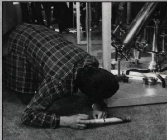
Un jeune captivé par un télescope de la salle des instruments scientifiques.

Lors de la séance sur les débuts de l'électricité et du magnétisme, les étudiants sont, entre autres, mis en présence de deux pierres aux pouvoirs d'attraction mystérieux, découvertes au cours de l'Antiquité. Il s'agit de la magnétite, un minéral de fer aimanté naturellement, et de l'ambre qui est en fait de la résine fossilisée. La pierre de magnétite sert d'aimant pour attirer des petits clous et l'ambre, une fois frotté sur une étoffe, attire vers lui des petits bouts de papier. L'éducateur explique alors que l'ambre,