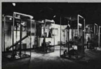
La salle des instruments scientifiques du Musée du Séminaire de Québec.

Après la conférence-démonstration, les jeunes sont invités à essayer eux-mêmes les expériences qui ont été expliquées. À cette fin, plusieurs tables sont mises à leur disposi-