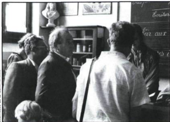
Écomusée de la Communauté

Il a semblé aujourd'hui nécessaire d'assurer en un même lieu le Château de la Verrerie la cohérence des travaux et repris par les trois organismes du Creusot en les fédérant dans le Centre culturel de rencontre et de recherche sur la civilisation industrielle. Ses actions diversifiées veulent montrer qu'une perspective culturelle vraiment contemporaine n'envisage plus la culture comme un domaine en marge des situations de travail; elle recouvre les divers