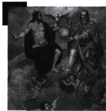
Anonyme, détail de La France apportant la foi aux Hurons de la Nouvelle France XVII e siècle. Huile sur toile 227,3 x 227,3 cm. Prêt de la collection du Monastère des Ursulines de Québec.

Une occasion unique de voir, pour la première fois, la plus importante exposition associant l'art et l'histoire de l'Église catholique au Québec.