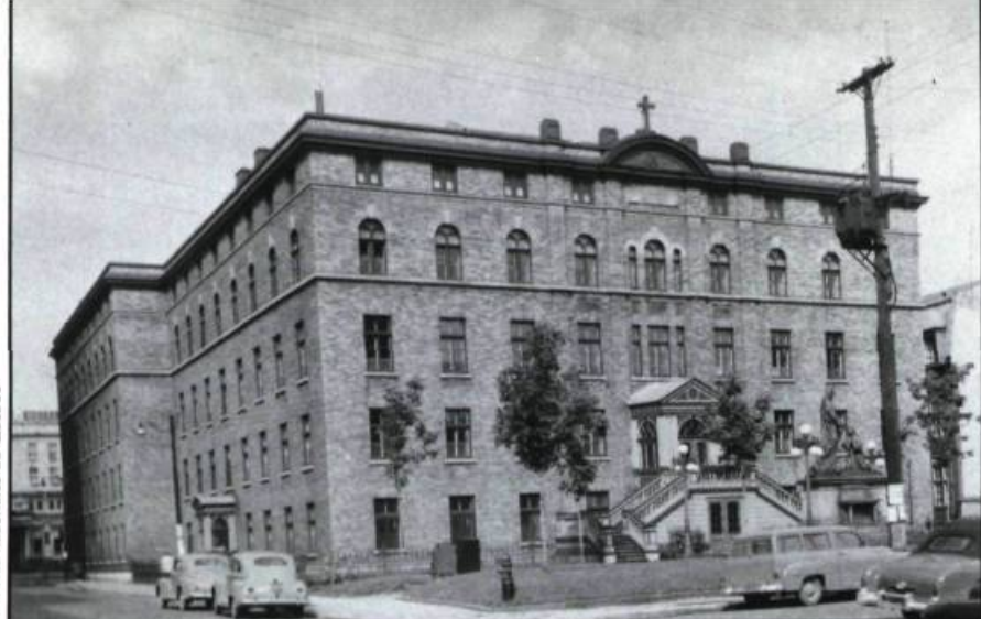
Le couvent de Saint-Roch à Québec, démoli pour faire place à l'hôtel Holiday Inn. En milieu urbain dense, les édifices religieux anciens résistent encore très mal.