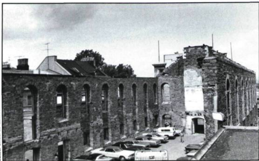
Le ministère des Affaires culturelles a accepté que l'église Saint-Patrick de Québec (1831, Thomas Ball-laingé, architecte) soit convertie en stationnement, après un incendie; on a même autorisé la démolition du chœur pour permettre l'accès des ruines... aux voitures.

vront pas à une nouvelle génération d'usagers. Une église demeurera une église tant que son image restera inchangée, peu importe que l'édifice serve ou non au culte aujourd'hui.