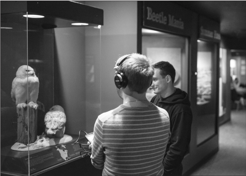
Figure 2: Un visiteur écoute la composition d'un étudiant tout en regardant l'objet qu'il avait sélectionné.

Le soir de l'évènement, j'ai placé un sac de couchage, deux oreillers, deux couvertures et trois dispositifs d'écoute sur les oreillers en dessous du dôme. Les visiteurs s'allongeaient sur le lit de fortune et écoutaient mon paysage sonore, Grounding , en fermant les yeux ou en regardant le plafond. [...] La partie la plus enrichissante du projet était de regarder les invités réagir à mon paysage sonore et interagir les uns avec les autres. Plusieurs fois, des mères et leurs enfants se sont tenus par la main ou se sont blottis l'un contre l'autre pendant qu'ils écoutaient. Les invités écoutaient ma pièce, puis invitaient leur partenaire à l'écouter. [...] Il y avait une telle réaction émotionnelle, je me sentais très touchée. J'ai été reconnaissante de voir des visiteurs émus se lier les uns aux autres grâce à ma pièce. Certains voulaient me parler et en apprendre davantage sur la pièce. D'autres voulaient me remercier de leur avoir donné cet espace pour se déconnecter du quotidien et se reconnecter à eux-mêmes, aux autres et au présent.