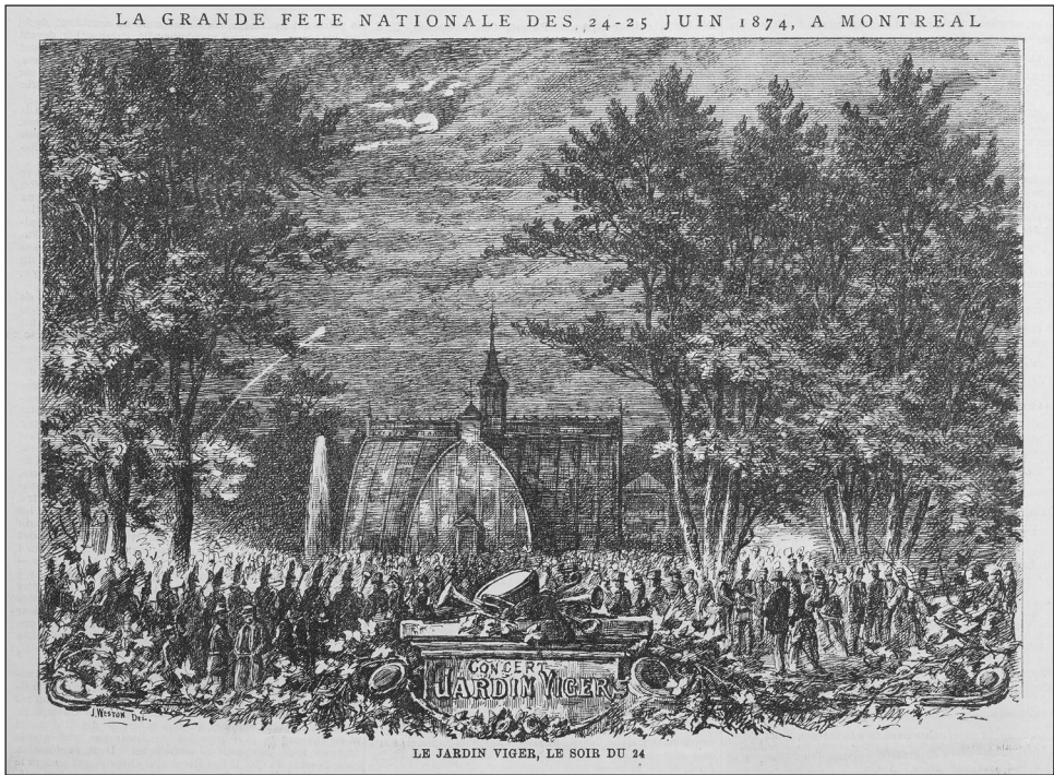
Figure 2 : La grande fête nationale des 24-25 juin 1874, à Montréal. Le jardin Viger, le soir du 24. L'opinion publique , 2 juillet 1874

construite dans le secteur ouest (1963-1966) et l'autoroute Ville-Marie reliant l'est à l'ouest éventre le secteur (1976). Ces aménagements modernes ne sont pas sans conséquence pour le quartier et le square: plus de 3 300 familles sont expropriées, des arbres sont abattus, des équipements urbains sont déplacés ou détruits (Bednarz 2013). Autour du square, les édifices des côtés sud et nord sont vidés et l'autoroute émerge du côté est. Le quartier ne possède plus la masse démographique qui lui permet d'offrir de l'animation dans le square. Le secteur prend les apparences d'un no man's land entre le Quartier latin, au nord, et le Vieux-Montréal, au sud, et entre le nouveau centre-ville anglophone, à l'ouest, et les secteurs ouvriers francophones, à l'est (Choko 1990). Historiques et nécessaires, la Maison du Père, le Old Mission Brewery et l'Accueil Bonneau, trois organisations qui viennent en aide aux plus démunis, comptent alors parmi les institutions les plus importantes du quartier.