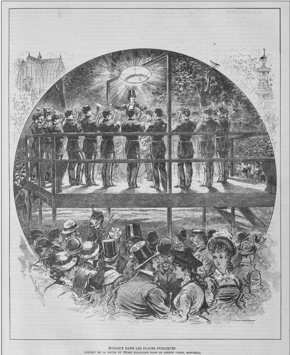
Figure 1 : Musique dans les places publiques. Concert de la bande du 65 e bataillon dans le jardin Viger, Montréal. L'opinion publique , 23 septembre 1880

serre et les vespasiennes. Le square se retrouve seul avec les ouvriers du secteur et les indigents (Choko 1990 ; De Laplante 1990 ; Le patrimoine du Vieux-Montréal en détail 2002 ; Héritage Montréal 2008).