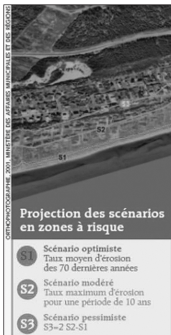
Figure 2: Modèle montrant les scénarios projetés des zones à risque 11