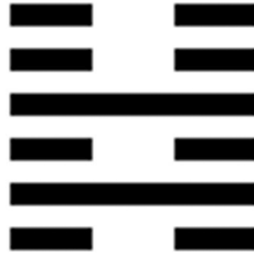
Figure 1: Exemple de l'hexagramme n° 40 «Libération» (Xiè 解)