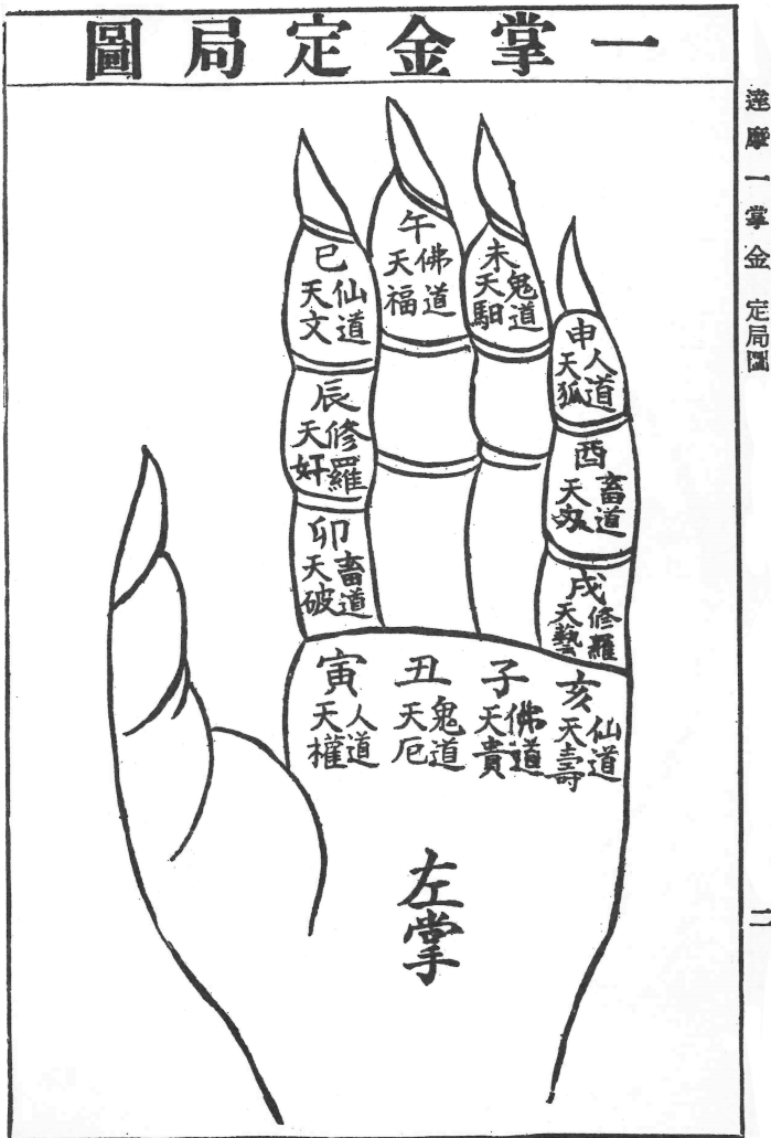
Figure 4: Diagramme de la main du Trésor de la paume (Yixing 1995:2)

Chacune des douze positions marquées sur les phalanges des doigts est associée à trois séries d'éléments qui composent les différentes figures mantiques : les signes temporels des douze branches terrestres 6 qui servent principalement au décompte ; les six voies du destin et les douze étoiles de la destinée qui guident l'interprétation.