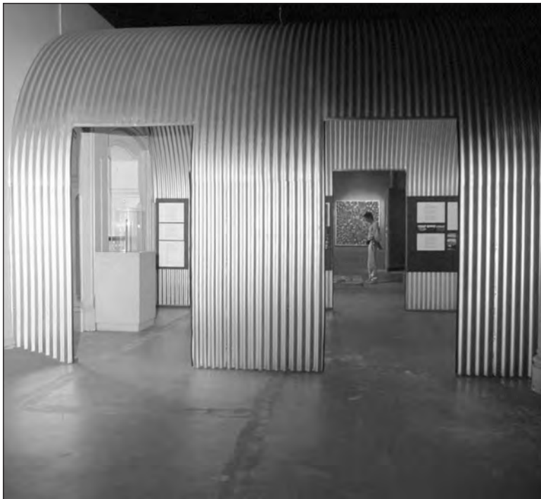
Photo 6 : réplique d’une maison de tôle, entrée de l’exposition

rendit nostalgiques. Lors de son passage, un des peintres fit la remarque suivante : « poor bugger! (pauvres diables!) ». La tôle ondulée lui rappela les premières maisons construites à Yuendumu que lui et ses proches, alors chasseurs-cueilleurs nomades, furent contraints d’habiter.