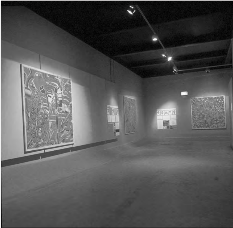
Photo 1 : vue partielle de l'exposition Yuendumu Paintings : Out of the Desert , 1988.

Avant leur expérience avec le SAM, la participation des artistes se cantonna à des danses rituelles exécutées lors des vernissages, des apparitions symboliques de « sauvages nobles » sans voix. Les peintres n'avaient jusqu'alors jamais été amenés à réfléchir ensemble sur les thèmes des tableaux qui seraient exposés, ou comment leurs œuvres pourraient être exposées. Les artistes ancrèrent leur sélection d'histoires du Temps du Rêve dans les politiques locales et religieuses de l'époque, dans les visites de sites sacrés avec les représentants du musée, dans leur savoir et savoir-faire cérémoniels, dans leurs relations quasi-parentales avec le musée et ses émissaires, dans leurs expériences passées avec d'autres expositions et dans leur façon d'imaginer ce qu'ils voulaient que le public puisse « comprendre ». On pourrait voir dans ces narrations identitaires une véritable « mise en intrigue » 24 – l'introduction de l'intrigue de textes ou romans polyphoniques – comme Paul Ricœur la définit, mais avec un biais interculturel qu'il a négligé. Ricœur affirme que l'intrigue est ancrée dans une pré-interprétation du monde d'action qui est reconfiguré lors de la création et de la réception d'un texte ou d'un roman. Cette notion de mise en intrigue s'applique pleinement au