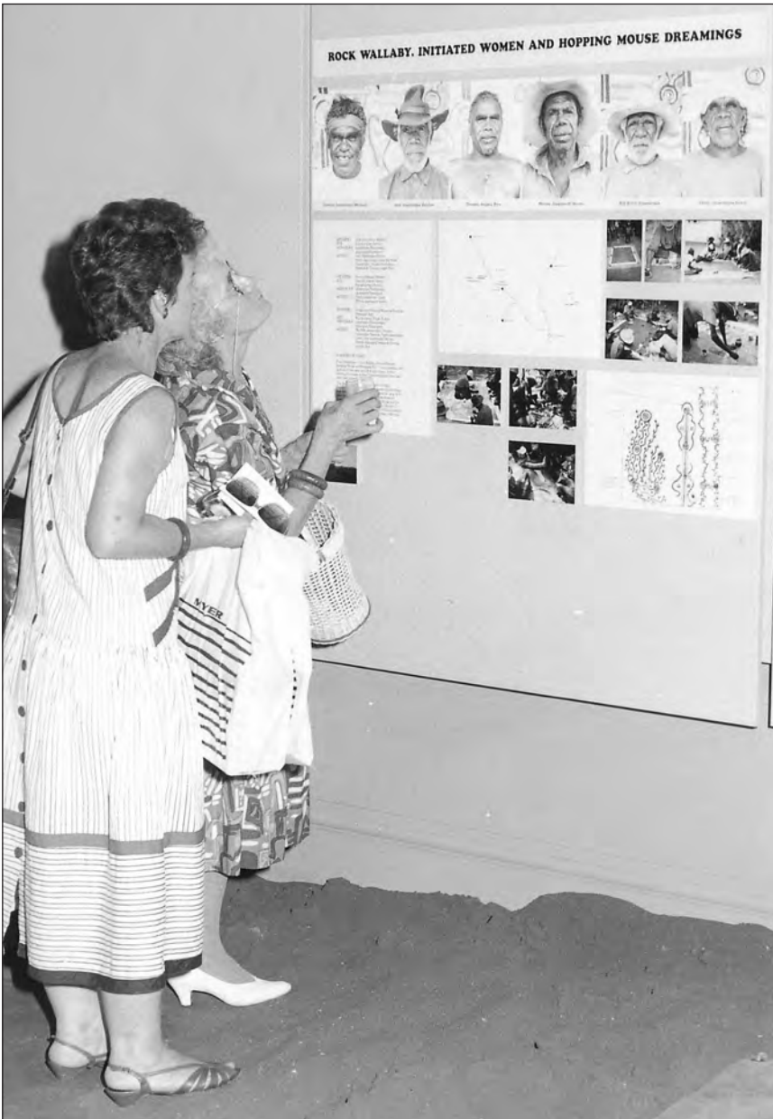
Photo 5: deux visiteurs lisant les informations sur les artistes et la signification des formes abstraites de la peinture exposée au sol.

Les artistes, quant à eux, chantent les histoires mythiques. Le reste du musée fut visité très rapidement par les artistes. L'entrée de l'exposition – avec une réplique des premières maisons en tôle ondulée des années 1950-1960 – les