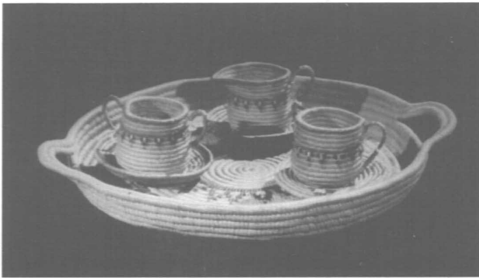
Figure 3 : Service à thé des Salish de l'intérieur en vannerie spiralée de racines de thuya fendues ; adaptation à une nouvelle économie (courtoisie du Royal British Columbia Museum, Victoria, Colombie-Britannique, Numéro de catalogue du négatif : XX).

On peut observer ces changements dans les collections dont on a parlé plus haut. On trouvera à la figure 3 un service à thé de type européen produit dans une vannerie spiralée de racines de thuya fendues.