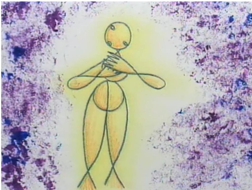
Image tirée de C'est en revenant du Congo (Desharnais et Lebrasseur, 1998)