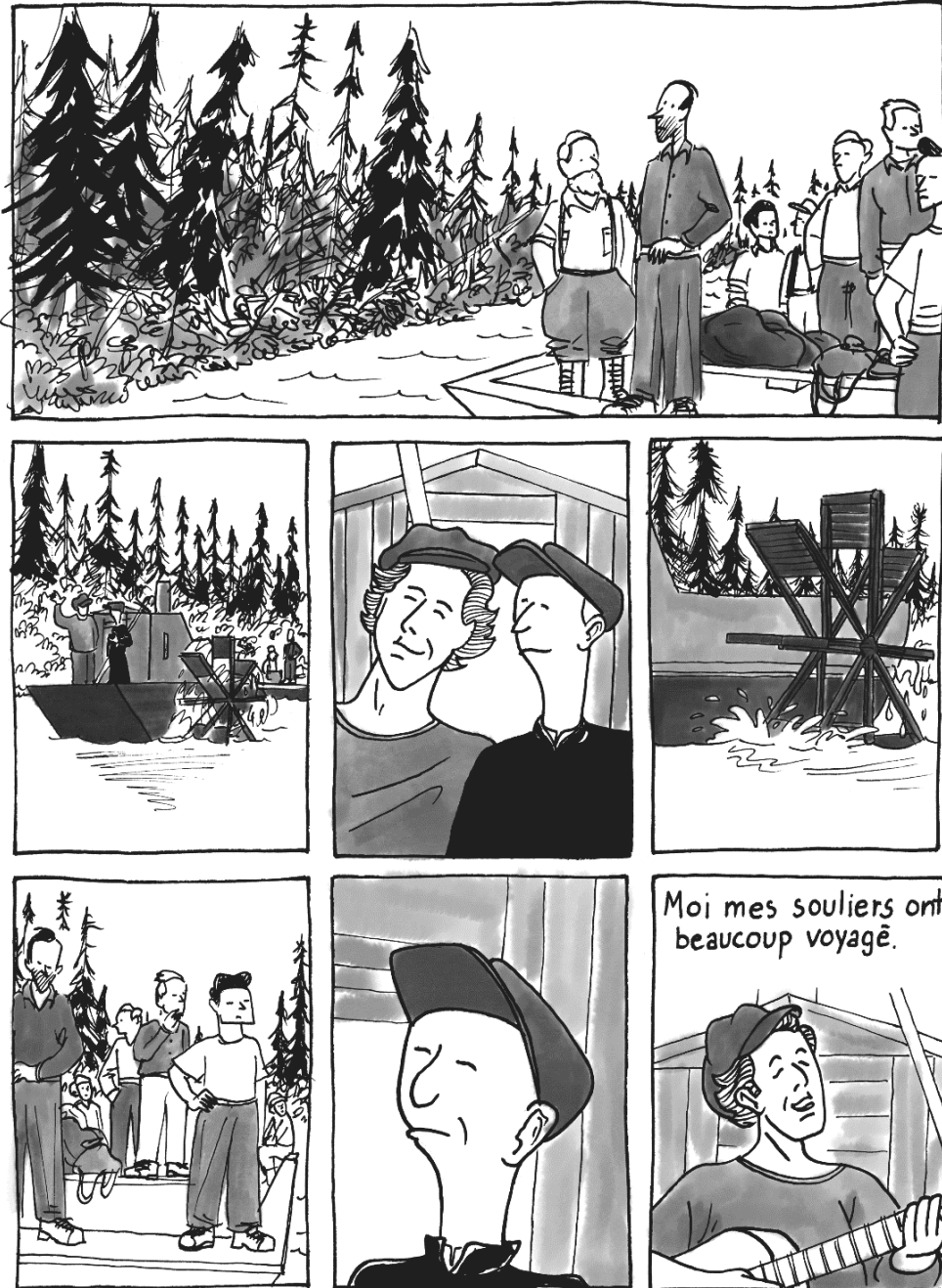
Image tirée de La petite Russie (Desharnais, 2018), référant au film Les Brûlés (Devlin, 1959)

Selon moi, la référence la plus évidente au cinéma dans mes bandes dessinées se situe dans La petite Russie (2018). Aux pages 99 et 100, j'ai repris presque plan par plan une scène du film Les brûlés (Bernard Devlin, 1959) qui a été tournée en Abitibi, là où se déroule l'histoire de La petite Russie .