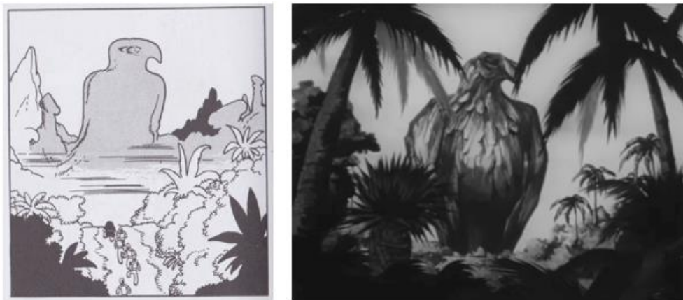
Illustrations 8 – Tezuka (1947 et 1965)

Si l'on connaît le goût des Japonais pour les classiques de la littérature occidentale ( Heidi , Tom Sawyer ou Princesse Sarah , adaptés en séries animées), le roman de Stevenson occupe une place à part, avec plusieurs adaptations pour le cinéma ou la télévision. En 1965, Tezuka lui-même réalise, avec le studio d'animation Mushi Productions, un téléfilm d'une heure intitulé lui aussi Shin Takarajima . Il ne s'agit pourtant pas d'une adaptation de son manga éponyme mais bien du classique de Stevenson, assez fidèle bien que les protagonistes soient incarnés par des personnages animaliers. Le seul lien avec le manga tient dans une sorte de clin d'œil ou d'auto-citation : sur l'île, une des montagnes qui sert de repère pour trouver le trésor a la forme d'un aigle (illustrations 8).