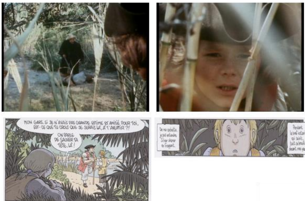
Illustrations 6 – Jim caché chez Hough (1972) et Chauvel et Simon (2006)

Dans d'autres cases encore, le film de Flemming apparaît comme une source d'inspiration visuelle : Jim montant à la poupe de l'Hispaniola , Jim encerclé par les pirates lors de son retour au fortin, dans une scène éclairée à la lueur des torches. On pense également à la scène lors de laquelle Jim assiste, caché dans les fourrés, au meurtre de Tom, le marin fidèle, par Long John : la lectrice du roman, comme le public du film de Hough, est d'abord placée du point de vue de Jim, caché dans les buissons, tandis que les personnages de Silver et Tom sont vus à travers la végétation. Puis, dans un champ-contrechamp, le point de vue s'inverse, et l'image se concentre sur le visage de Jim en gros plan, reflétant sa sidération, accentuée encore dans la bande dessinée par le choix du plan panoramique (illustrations 6).