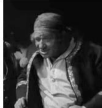
Illustration 1 – Silver (Pratt, 1965) et incarné par W. Beery (Flemming, 1934)

On pense également à la série de comics consacrée à Long John Silver dans le magazine Long John Silver and the Pirates (1956 et 1957) : dans les premiers épisodes, Long John Silver a nettement la face rieuse de Robert Newton dans le film de Haskin (1950). Cependant, les dessinateurs des épisodes suivants prendront de la distance avec le physique de l'acteur, jusqu'à s'en éloigner totalement comme le montre la capture du film, pratiquement recopiée dans la première case de la bande dessinée de Charlton Comics et les changements apportés aux trois autres (illustration 2). Dans les derniers épisodes, il n'est plus reconnaissable que grâce à son habillement (costume rouge et tricorne noir) et ses accessoires (jambe de bois et cache œil dans le dernier numéro), accessoires qui sont d'ailleurs une construction totalement indépendante de la description du personnage dans le roman, preuve que le comics s'est peu à peu affranchi de la tutelle du roman, d'abord en s'appuyant sur le personnage de Silver dans le film, puis en le redéfinissant totalement.