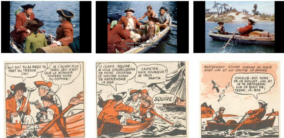
Illustrations 7 – Le « copier-coller » entre Haskin (1950) et Ushler (1955)

comparaison des différents plans du film avec les vignettes de la bande dessinée est particulièrement révélatrice du « copier-coller » réalisé par Ushler : les plans, la position des personnages, etc. sont identiques (illustrations 7). Tout au plus le dessinateur opère-t-il parfois un retournement de l'image à 180° ou condense-t-il, dans une même image, les personnages regardant et l'objet de leur attention, comme dans le plan qui clôt le récit.