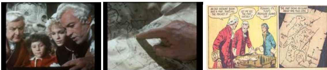
Illustrations 3 – La carte chez Hough (1972) et Bugg (1942)

En ce qui concerne le gros plan, les bandes dessinées qui adaptent L'Île au trésor en font un usage plus répandu que les films. En effet, elles utilisent le gros plan sur le visage des personnages pour mettre en valeur leurs émotions. C'est particulièrement vrai pour le personnage de Jim : si, dans le roman, le texte renseignait sur ses émotions (puisque'il est le narrateur), en bande dessinée, c'est le gros plan qui va jouer ce rôle. Le visage de Silver pourra aussi être l'objet de gros plans, notamment pour mettre en évidence sa duplicité. Cependant, dans les adaptations à l'écran, les gros plans sur les personnages sont relativement rares et semblent réservés au traitement d'objets importants dans la narration, notamment la marque noire et la carte. On remarque des plans semblables dans les deux médiums concernant le premier, avec un gros plan sur des mains tenant le petit papier marqué d'un rond noir. Quant à la découverte de la carte, on observe fréquemment une alternance entre un plan rapproché sur les personnages, et un gros plan centré sur la carte, comme si la caméra adoptait le point de vue des personnages pour voir ce qu'ils regardent (illustrations 3). Le gros plan fonctionne alors comme un outil de focalisation interne.