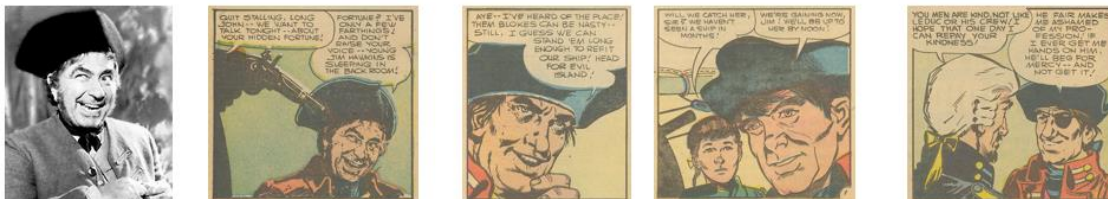
Illustrations 2 – Silver incarné par R. Newton (Haskin, 1950) et dans Long John Silver and the Pirates (de 1956 à 1957)

On pense également à la série de comics consacrée à Long John Silver dans le magazine Long John Silver and the Pirates (1956 et 1957) : dans les premiers épisodes, Long John Silver a nettement la face rieuse de Robert Newton dans le film de Haskin (1950). Cependant, les dessinateurs des épisodes suivants prendront de la distance avec le physique de l'acteur, jusqu'à s'en éloigner totalement comme le montre la capture du film, pratiquement recopiée dans la première case de la bande dessinée de Charlton Comics et les changements apportés aux trois autres (illustration 2). Dans les derniers épisodes, il n'est plus reconnaissable que grâce à son habillement (costume rouge et tricorne noir) et ses accessoires (jambe de bois et cache œil dans le dernier numéro), accessoires qui sont d'ailleurs une construction totalement indépendante de la description du personnage dans le roman, preuve que le comics s'est peu à peu affranchi de la tutelle du roman, d'abord en s'appuyant sur le personnage de Silver dans le film, puis en le redéfinissant totalement.