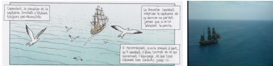
Illustrations 5 – L'Hispaniola chez Chauvel et Simon (2007) et Hough (1972)

Dans d'autres cases encore, le film de Flemming apparaît comme une source d'inspiration visuelle : Jim montant à la poupe de l'Hispaniola , Jim encerclé par les pirates lors de son retour au fortin, dans une scène éclairée à la lueur des torches. On pense également à la scène lors de laquelle Jim assiste, caché dans les fourrés, au meurtre de Tom, le marin fidèle, par Long John : la lectrice du roman, comme le public du film de Hough, est d'abord placée du point de vue de Jim, caché dans les buissons, tandis que les personnages de Silver et Tom sont vus à travers la végétation. Puis, dans un champ-contrechamp, le point de vue s'inverse, et l'image se concentre sur le visage de Jim en gros plan, reflétant sa sidération, accentuée encore dans la bande dessinée par le choix du plan panoramique (illustrations 6).