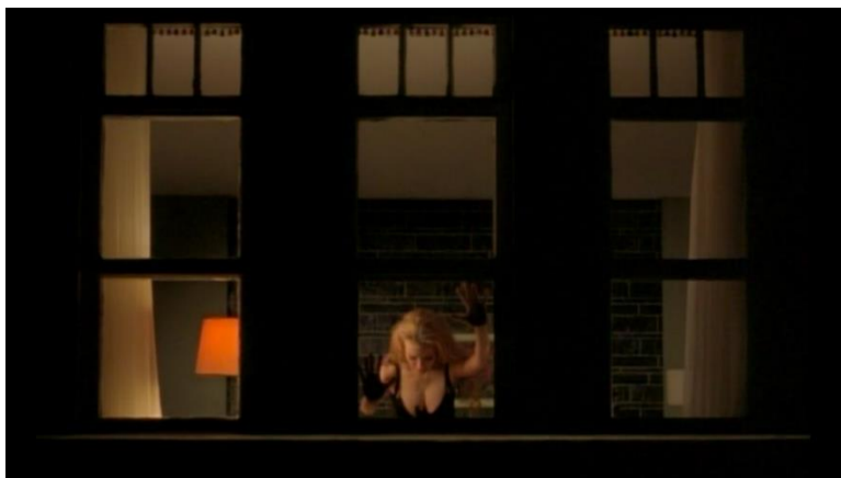
(Véra, enfermée dans l'appartement de Léopold, Gouttes d'eau , 2000, 1h18'15'')

Lorsque Franz meurt, Véra pleure à ses côtés et, une fois que Léopold, désintéressé, constate le décès, elle l'enveloppe entièrement dans son grand manteau, scellant le lien entre ces deux créatures impuissantes. Les derniers plans du film montrent Véra dans le salon, filmée de l'extérieur de l'appartement, essayant vainement d'ouvrir une fenêtre; une fois qu'elle comprend qu'elle n'y arrivera pas – on peut ainsi croire qu'elle ne pourra plus s'échapper à la cruauté de Léopold – elle demeure immobile tandis que nous entendons en son off « Traüme » (1970) interprétée par François Hardy, la chanson que Franz voulait écouter au début de l'acte. La théâtralité éclatée privilégiée par Ozon se manifeste une dernière fois à l'aide de ce très lent travelling arrière de la caméra. En nous éloignant du lieu du drame, il nous place de manière explicite dans la position de spectateur qui observe une actrice, en posture figée, attendant la fermeture du rideau ou le noir complet sur scène.